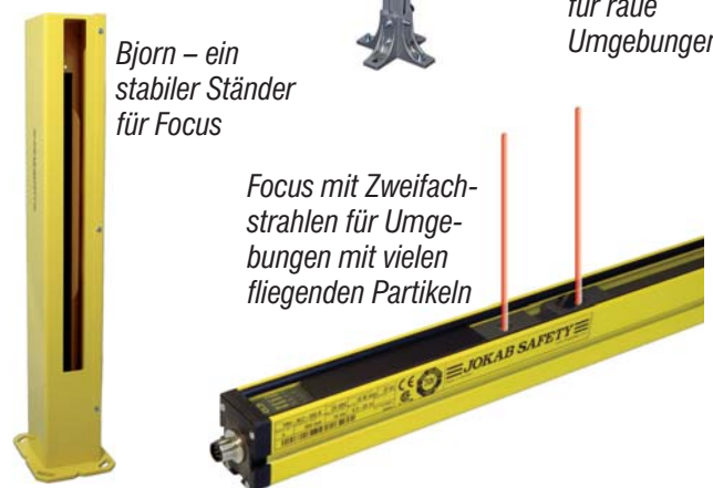
Focus mit Zweifachstrahlen für Umgebungen mit vielen fliegenden Partikeln